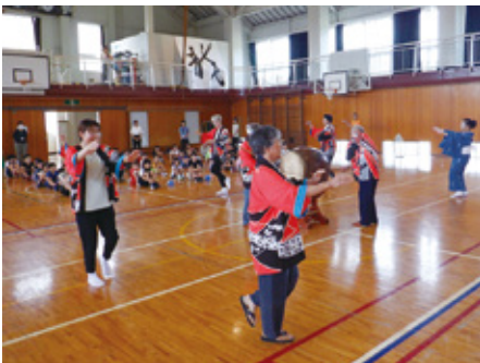
甚句体験での活動 （やまと本部三用小学校）