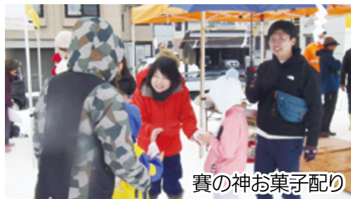
賽の神お菓子配り