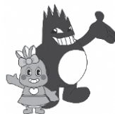
こぶしちゃん&はっかいさん

教室一覧 スポパラでは、多くの教室・事業を開催しています。自分に合ったプログラムを見つけましょう。