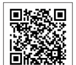
子若センター紹介ページ