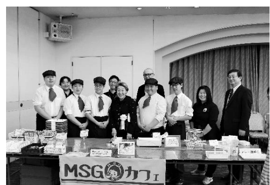
高等部 MSG カフェ (橋本元首相夫人と一緒に)