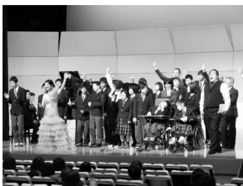
中学部 さとうきび畑コンサート