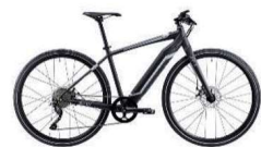
最新スポーツ電動自転車 BESV JF1