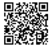
「土砂災害警戒情報システム」のQRコード

新潟県土砂災害警戒情報システムのホームページで、雨量や警戒レベルに係わる情報や解説を見ることができます。