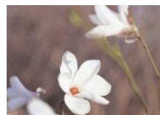
市の木「コブシ」 Magnolia (city tree)