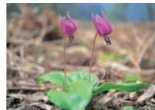
市の花「カタクリ」 Dogtooth Violet (city flower)