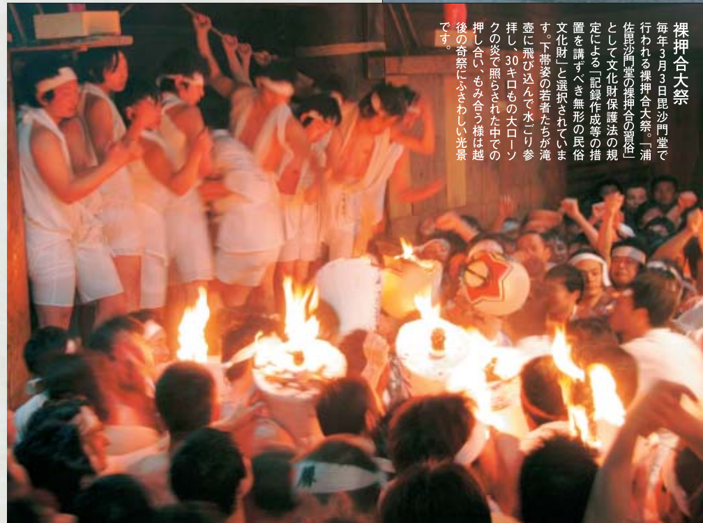
Hadaka-oshiai Grand Festival