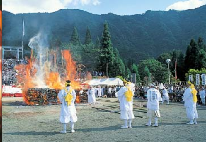
大崎里宮 Hakkai Mountain Fire Walking Grand Festival

八海山火渡大祭 山岳信仰の霊場として人々に尊崇されてきた八海山尊神社。霊峰八海山登山口の山口、大崎、大倉の各里宮で行われる火渡大祭には全国から数千人もの信者が訪れ、無病息災を祈り、火中を素足で渡り歩きます。