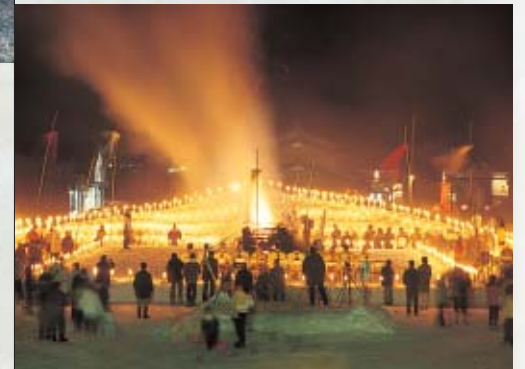
Shiozawa Seppu Festival

巻機権現火渡り 巻機権現は、その名のとおり巻機織りの神様とされ、地元塩沢地域をはじめ六日町や十日町の機織り業者の信仰を集めています。修験者による火渡りの行の後、「無病息災」家内安全を祈り、一般の方も火渡りに参加できます。