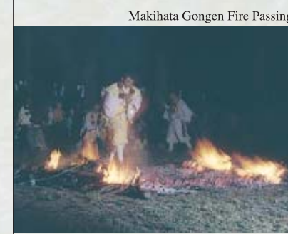
Makihata Gongen Fire Passing

塩沢まつり(住吉神社祭礼) 住吉神社を中心に、子どもみこしやバンドフェスティバルダンス、わんこそば選手権、花火大会など、さまざまなイベントが繰り広げられます。