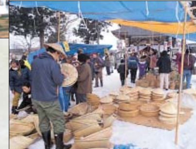
Ichinomiya Shrine Farming Tool Market

しおざわ雪譜まつり 「北越雪譜」の著者、鈴木牧之をしのぶ雪と炎の祭典。護摩供養の大きな炎と600本のローソクの灯りです。会場は幻想的な雰囲気になります。雪譜なべや福餅まき、雪中歌舞伎などの楽しみもあります。