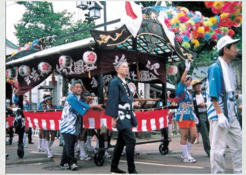
Shiozawa Festival (Sumiyoshi Shrine Festival)

塩沢まつり(住吉神社祭礼) 住吉神社を中心に、子どもみこしやバンドフェスティバルダンス、わんこそば選手権、花火大会など、さまざまなイベントが繰り広げられます。