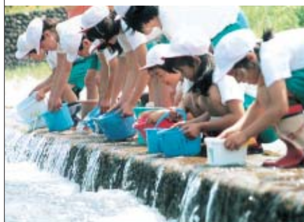
稚魚の放流 Releasing fry