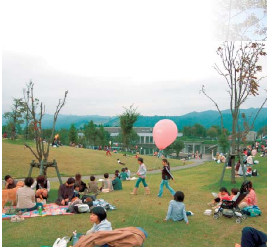
八色の森公園 Yairo Forest Park