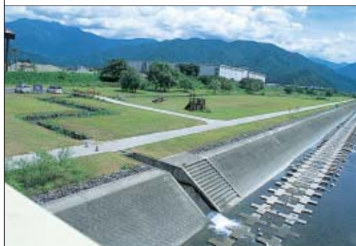
さくり親水公園 Sakuri Water Park

We will consider how to save natural resources and energy making the most of the special character of Minamiuonuma City and how to convert to and utilize new energy. Also, we will reinforce monitoring of ground subsidence areas. We will promote utilizing melting snow as well, so that the city does not have to depend on underground water.