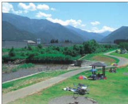
登川河川公園 Nobori River Park

● 自然環境の保全と活用 ● 循環型社会の創造 ● 新エネルギーの推進と新エネルギーへの転換 ● 生活環境の向上