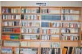
国際教育文庫 別称「中山文庫」