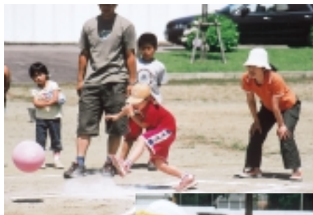
キックベースボール

ふれあい講座では、だれでも簡単に参加できる「手作り講座」と、親子と一緒にできる「出前講座」を予定しています。お気軽に参加してください。