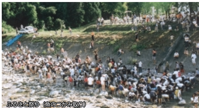
ふるさと祭り(魚のつかみ取り)

地域の自然や風景、そこに住む人の暮らしの様子は、年々いつのまにか変わってしまいます。五十沢分館では、地域の歴史を保存するため、昔の写真を収集しています。お持ちの方は、分館までご一報ください。