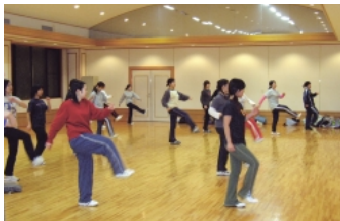
エアロビクス講座

上記以外でも、交流・学習・文化芸能活動等の場として、どなたでも無料でご利用いただけます。利用希望者はヤングプラザ南魚沼へお問合せください。