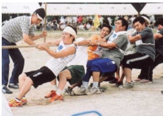
町民運動会・綱引き