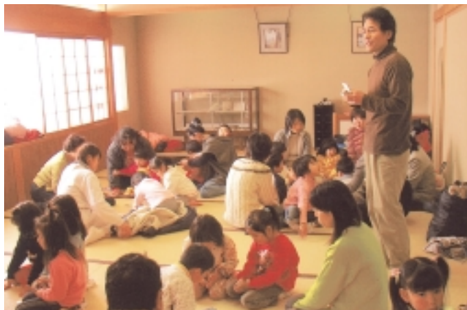
子ども育成かるた大会▶