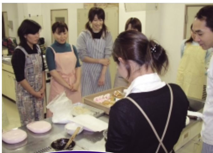
手軽にできるお菓子づくり

※上記受講料のほか、教材費は個人負担となります。各講座とも定員になりしだい締め切ります。