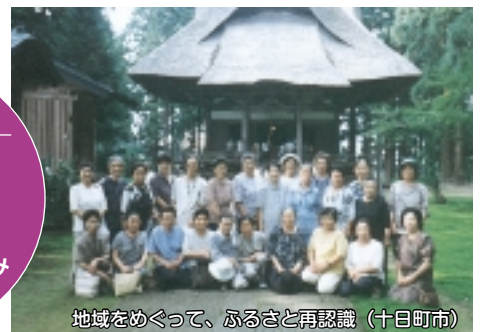
地域をめぐって、ふるさと再認識 (十日町市)