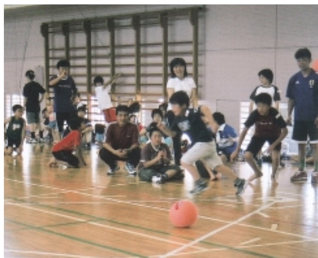
親子キックベースボール大会