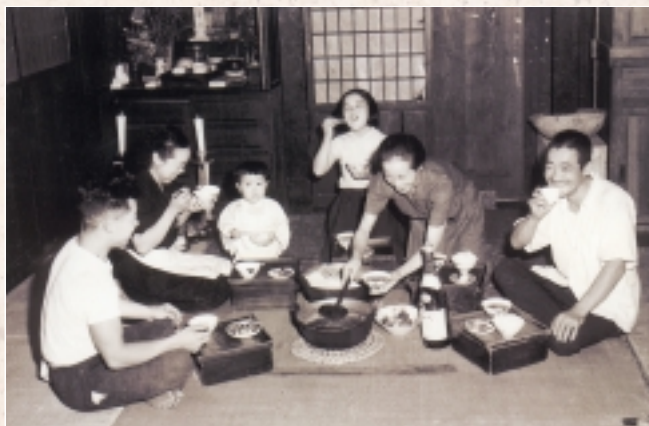
箱膳での楽しい夏の夕食(昭和28年:1953年ころ)