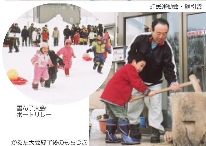
雪ん子大会 ポートルレー