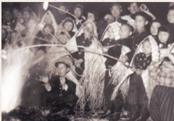
かがり火にあたる子供達(昭和28年:1953年ころ 欠ノ上にて)

「郷土史」の発行に先立ち、六日町地区の歴史の分野ごとにスポットを当てた双書を1号から4号まで発行します。すでに、1～2号は発行済みで、3号は今までに廃校になった小、中、高校の思い出を特集する予定です。(価格：1,000円)