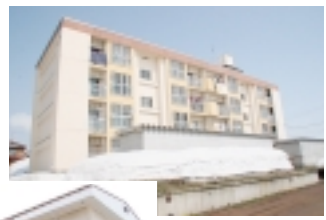
市内の一般的な公営住宅 (イメージ)