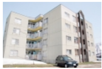
県営上町住宅梅棟