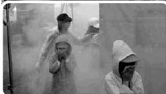
三用小体育館から火災発生、 付近に延焼の恐れ!