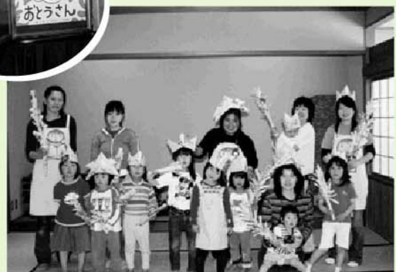
新聞紙であそんだよ！