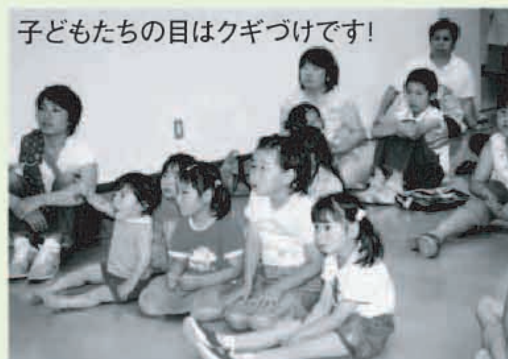
子どもたちの目はクギづけです!

気づきました。 ・初めて参加しました。親子とも楽しい時間が過ごせました。手作りの紙芝居もすばらしくて感動です。ぜひまた参加したいと思っています。 ・何日も前から娘が人形劇「みにくいあひるの子」を楽しみにしていました。お話を聞いて満足していました。