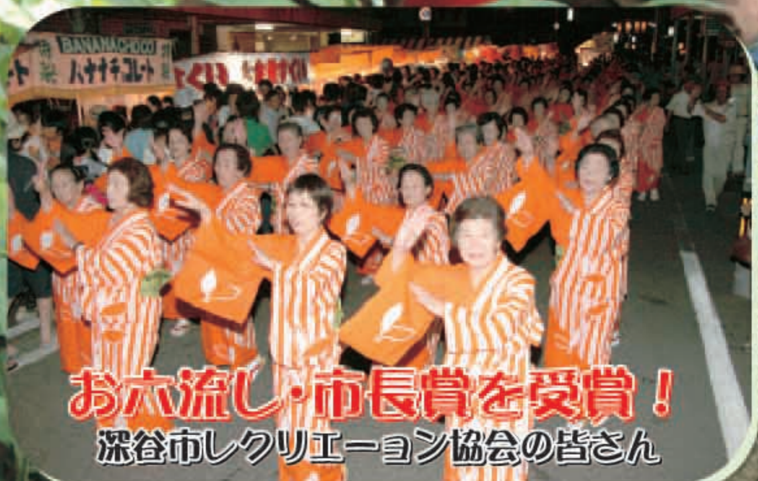
お六流し・市長賞を受賞! 深谷市レクリエーション協会の皆さん

友好親善都市である深谷市の市民団体の皆さんが、六日町まつり期間に合わせて、南魚沼市に遊びに来てくれました。(関連15ページ)