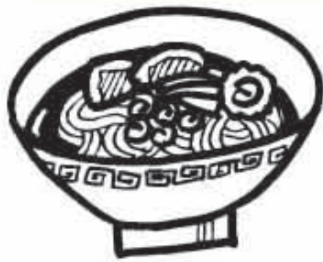
ラーメン 6～9g (汁まで全部飲んで)