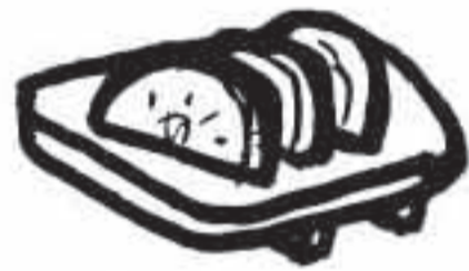
たくあん 2g (半月1cm2切)