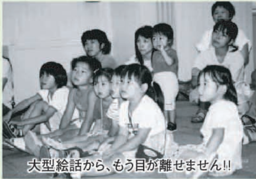
大型絵話から、もう目が離せません!!