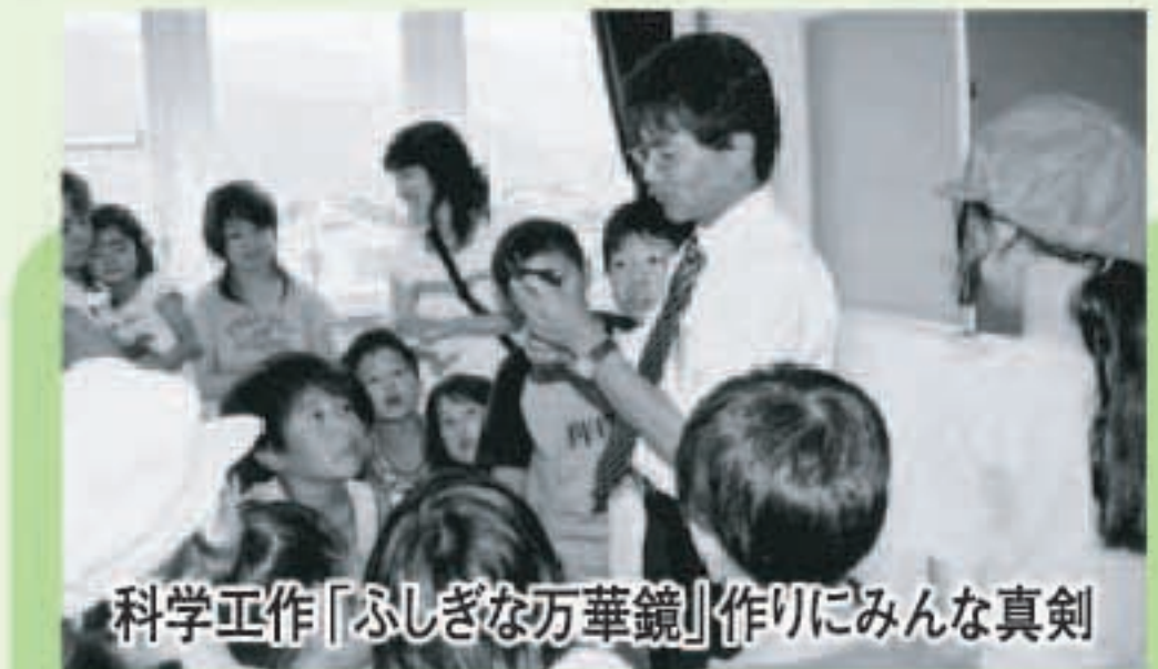
科学工作「ふしぎな万華鏡」作りにみんな真剣