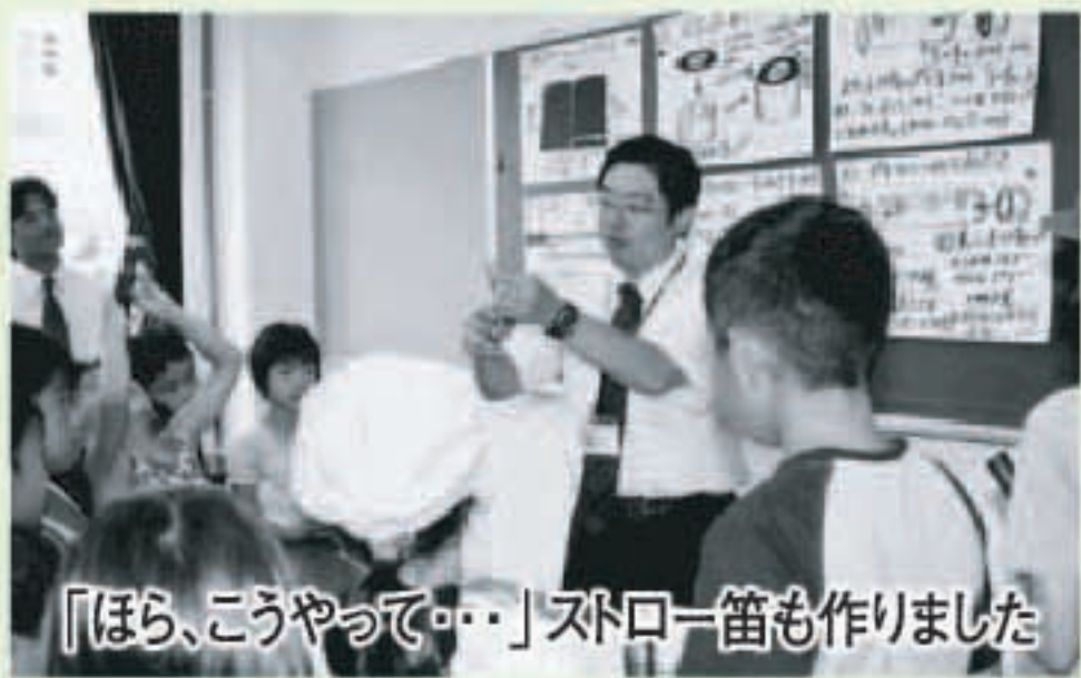
「ほら、こうやって・・・」ストロー笛も作りました