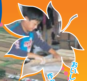
おいしいおソバを 作っちゃおうぞ