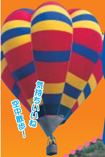
塩田製法 炭焼のり