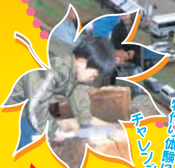
物作り体験に チャレンジ