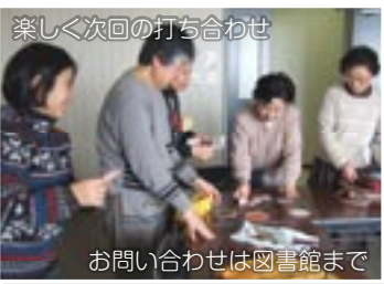
楽しく次回の打ち合わせ

本が好き、子どもが好き、お友達を作りたい、読み聞かせしてみたい方、図書館ボランティアに参加してみませんか。楽しく活動しています。