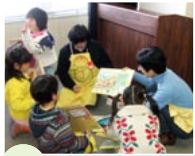
どれをかりていこうかなあ

子どもたちが楽しみにしていた「新潟ひょうしぎの会」の紙芝居、とても良かったです。またぜひ来てほしいです。たくさんさんの紙芝居を紹介してもらいありがとうございます。借りて帰ろうと思います。