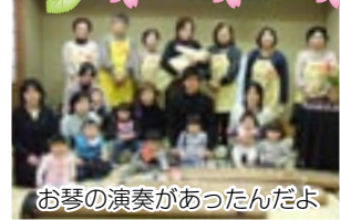
お琴の演奏があったんだよ