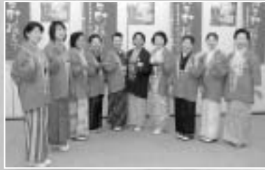
記者会見でPRする「あねさ会」の皆さん