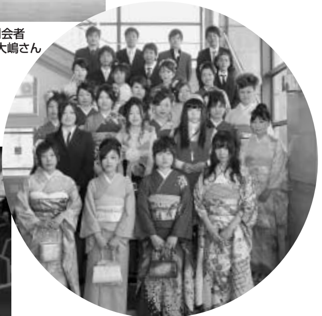
新成人役員の皆様、ありがとうございました