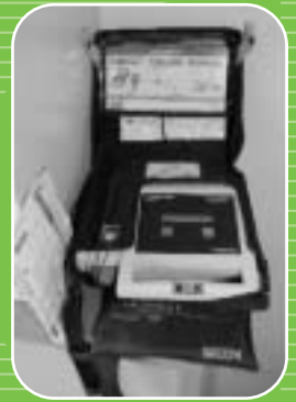
市民会館に配置のAED