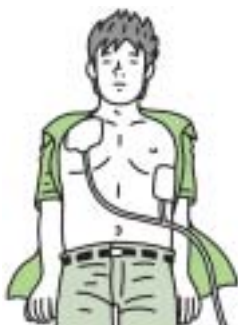
電極パッドの正しい位置(成人)

小児には、小児用パッドを貼ります。小児用パッドがなければ、やむを得ず成人用パッドを代用します。(乳児に対してはAEDは使用しません。)