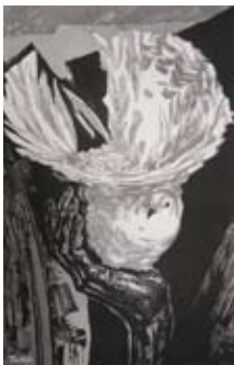
作品名 希望 1964

暖かなまなざしで人の命の尊厳や美しさを数々の木版画に結実させた木版画家 上野誠(1909-1980 長野県出身)、その作品は国内外で高く評価を得ています。市内にのこる作品を中心に、ゆかりの地南魚沼市で作品展を開催します。