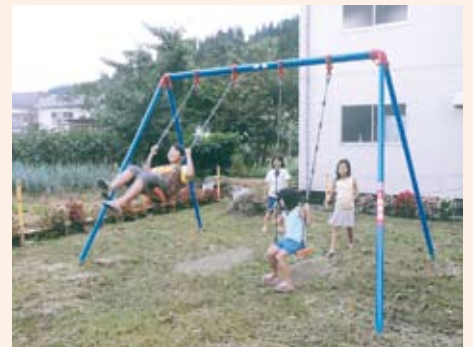
公園のブランコで遊ぶ地元の子どもたち