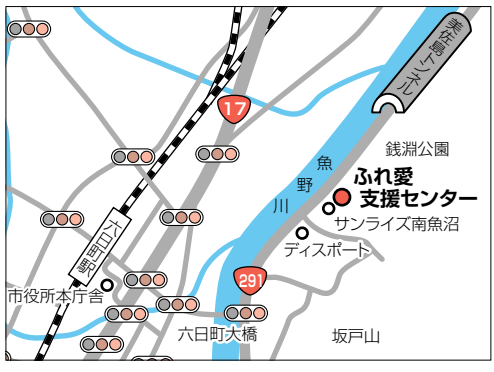
問 ふれ愛支援センター ☎772-8866

●消費生活相談窓口 ☎772-2541 ●研修室・多目的ホール・会議室がご利用できます。