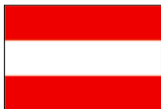
オーストリア セルデン 昭和57(1982)年