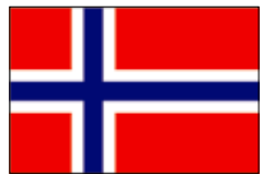
ノルウェー リレハンメル 昭和47(1972)年

南魚沼市には、世界50か国以上からの留学生が学ぶ国際大学があり、また、スキーを架け橋に3つの都市と姉妹都市盟約を結んでいます。さらに市内には国際交流の推進を目的とした8つの団体があり、それぞれ独自の活動を行っています。そのうち、現在活動中の6団体と、南魚沼市の中学生の海外交流事業をご紹介します。