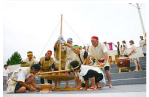
十日町市の大型マイギリによる採火式 (平成20年9月)