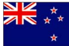
ニュージーランド アシュバートン 昭和62(1987)年