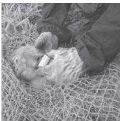
捕獲したサルに電波発信装置を付ける

サルの警戒心を利用した、被害防止対策です。集落全体で取り組むことにより、一層効果があがりま