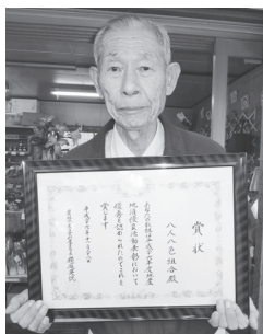
八人八色組合 南雲組合長

八人八色組合〔浦佐〕の直売所を通じた地産地消への取り組みが評価され、農林水産省食料産業局長賞を受賞しました。