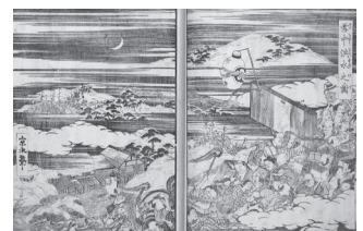
「雪中洪水之図」山東京水筆

江戸時代、河川の近くでは、しばしば「水揚げ」(洪水)が起きました。冬の大雪でせき止められた川の水や、春の大量の雪解け水が、村に流れ込