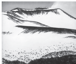
浅間山・峠の茶屋より

今企画展の会期もあとわずかです。初公開作品も展示中ですので、この機会にぜひご覧ください。6月27日(土)からは、美しい日本の四季をテーマに、新企画展「白の情景」を開催します。