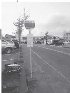
「市役所本庁舎」 医療シャトルバス乗降場