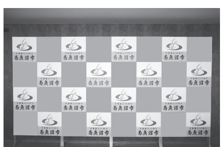
灰色の部分に広告を掲載します