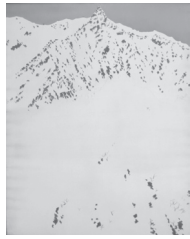
北アルプス・槍ヶ岳A

富岡は、各地の白と黒の世界を雪上車、小型飛行機などを駆使して探求し、特注のペインティングナイフによって描き出しました。白と黒の世界を堪能ください。