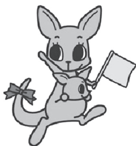
新潟県交通災害共済

新潟県交通災害共済の加入申込み用紙(ハガキ)を配布しています。交通事故で入院の実治療日数が7日以上ある場合、見舞金の対象になります。会費は年間1人500円です。交通事故に備えて加入ください。