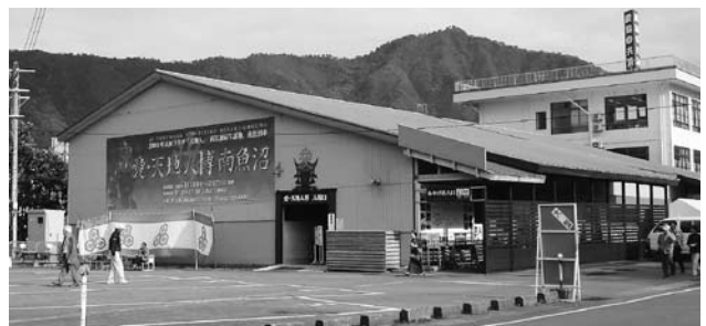
愛・天地人博南魚沼