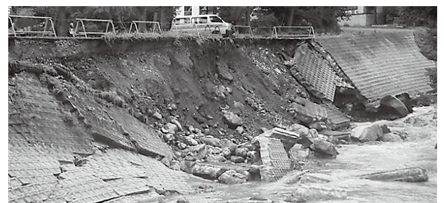
昨年(前年)の7月27日の水害

県の健康産業総合プロジェクトで、南魚沼をトータルに考えた基礎調査をお願いしている。また意欲のある既存企業を支援し、景気に左右されない安定的な産業をめざしたい。産業振興ビジョンは事業所が主体的に取り組むが、行政も役割を持って進める。