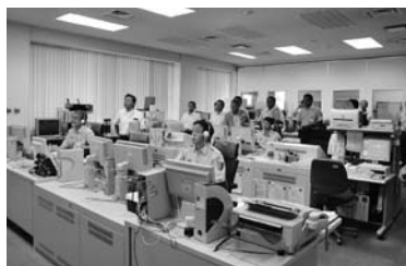
桐生みどり消防署