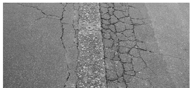
ひび割れが激しい消雪パイプ路線