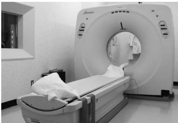
城内診療所検査器具

65歳以上で経済的、または環境的な理由で在宅での生活が困難な方が生活する施設です。