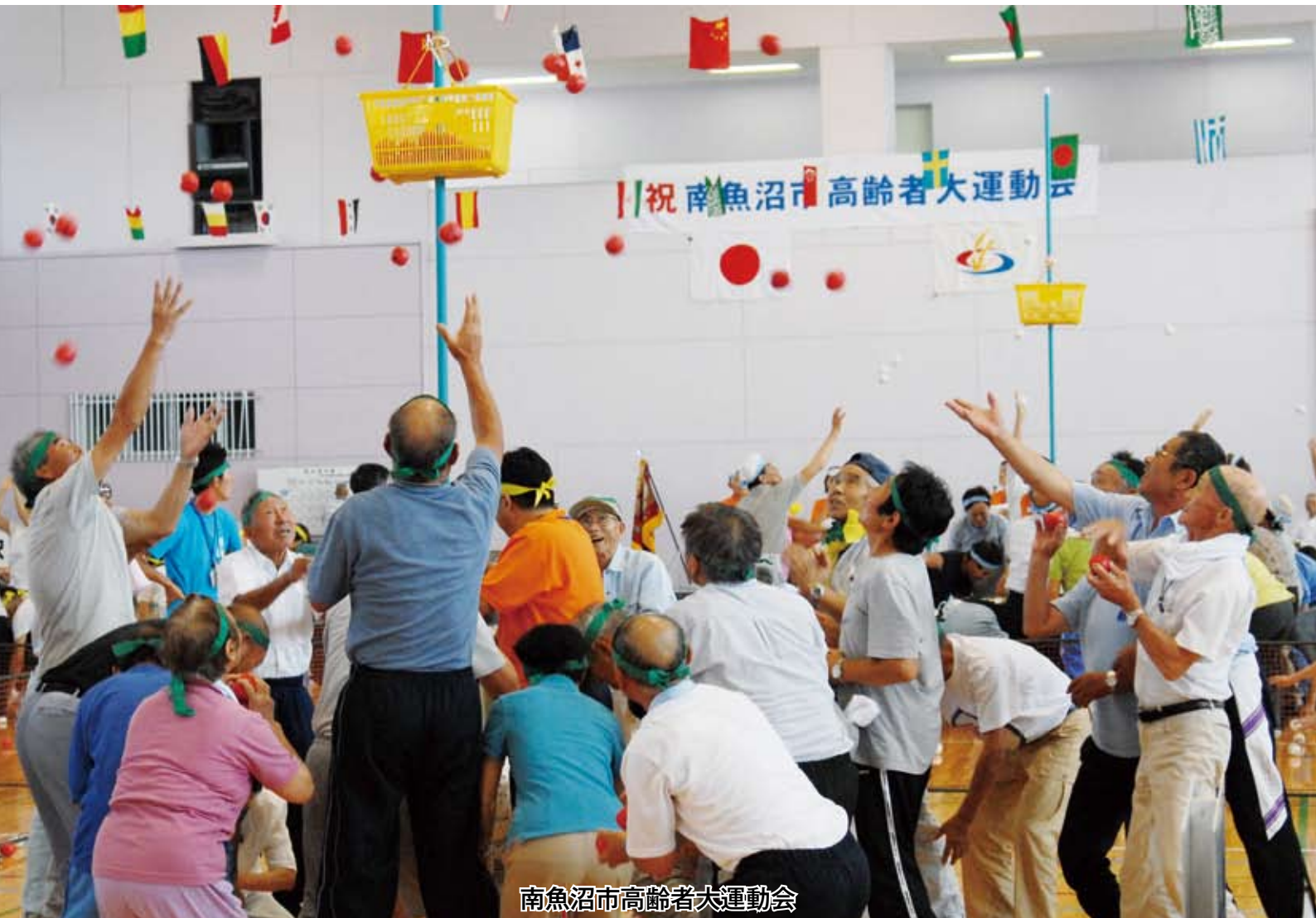
南魚沼市高齢者大運動会