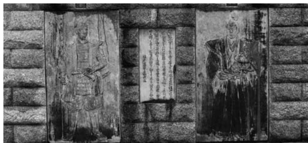
景勝公・兼統公レリーフ

る。それから色々な制度が変わる。しかし、地方はその時の政府与党の在り方によって方向性がある程度変わることはあり得るが、選挙の結果だけで一喜一憂することなく、市民の皆さん方が安全で安心して住んでいただける市政の実現に努めていきたいと思っています。