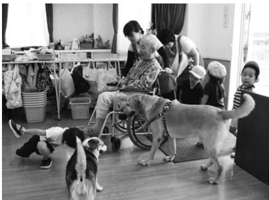
「しろうわ」での介護の様子

この施設は、「家で死ぬ」を基本理念に掲げ、介護現場の常識を否定し、介護を受ける側の常識、ものを考える「非常識な介護」、