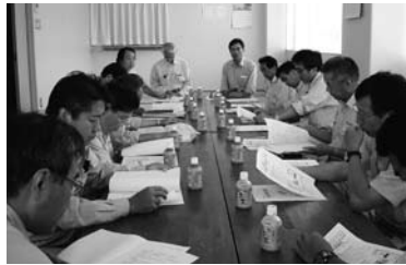
中之島地区センター