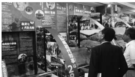
「風林火山ガーデン」