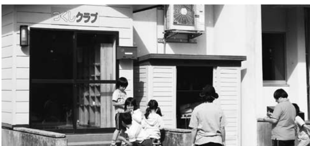
学童保育つくしクラブ