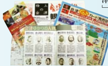
豊富なパンフレット