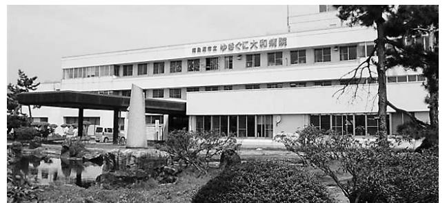
ゆきぐに大和病院