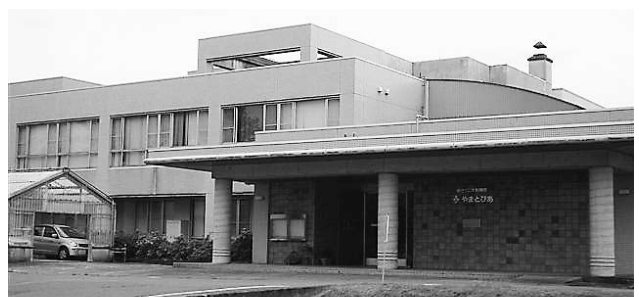
ゆきぐに大和病院 健友館