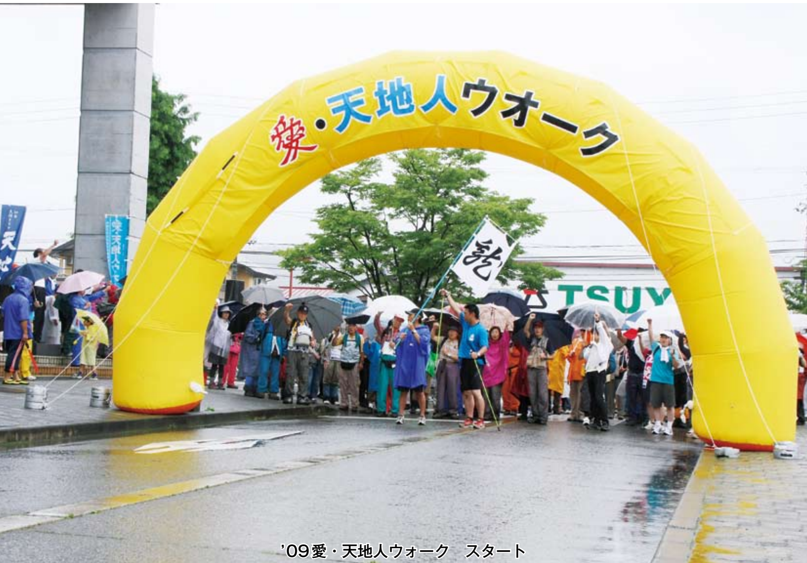
'09愛・天地人ウォーク スタート