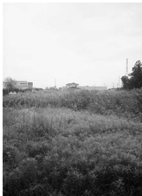
平坦地の耕作放棄地