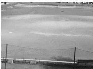
雨水が残る塩沢中野球部グラウンド