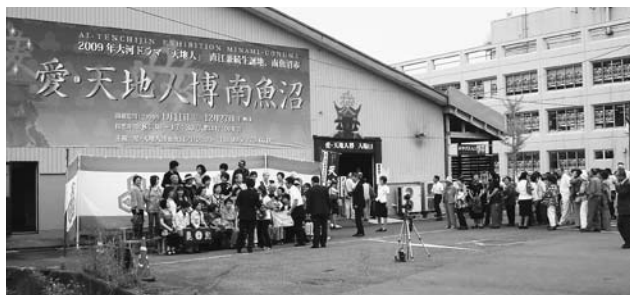
観光客で賑わう天地人博

ホームページへの掲載方法については検討する。特典については、今のところ考えていない。