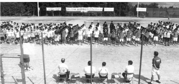
新潟県高校テニスフェスティバル

も構想策定には幅広い市民の意見を伺い、ご理解を頂きながら進めていきたいと考えている。周辺市有林の活用について、地元地域の皆さまが自ら汗を流して、この運動公園の機能向上の観点から努力されており、