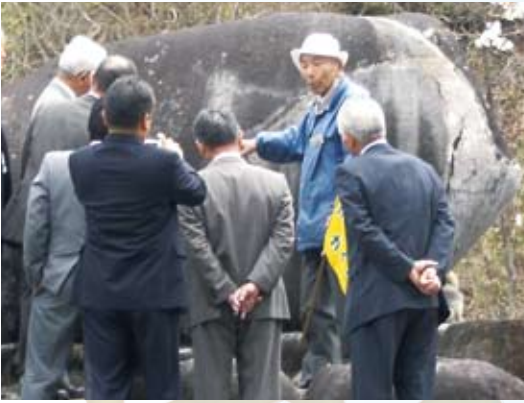
米沢市「おしょうしなガイド」

異色なのが大河ドラマ「新撰組」の舞台となり、観光客の増えた年の翌年も、落ち込みのなかった会津です。