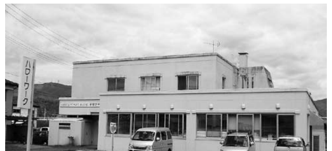
ハローワーク南魚沼

近年想定出来ない危機が発生している。今後、危機対策専門の室(課)の設置に向け検討する。