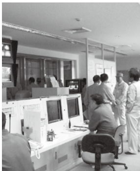
可燃ごみ処理施設内

・災害時要援護者個別支援計画の策定について ・新型インフルエンザに対する対応状況について