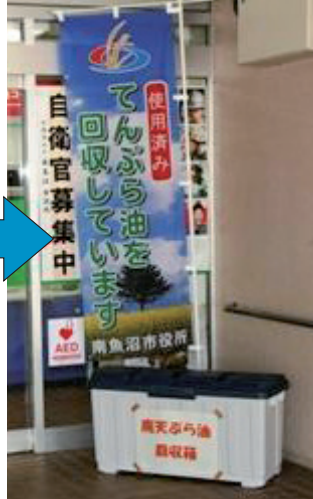
回収場所にある ボックスに入れる