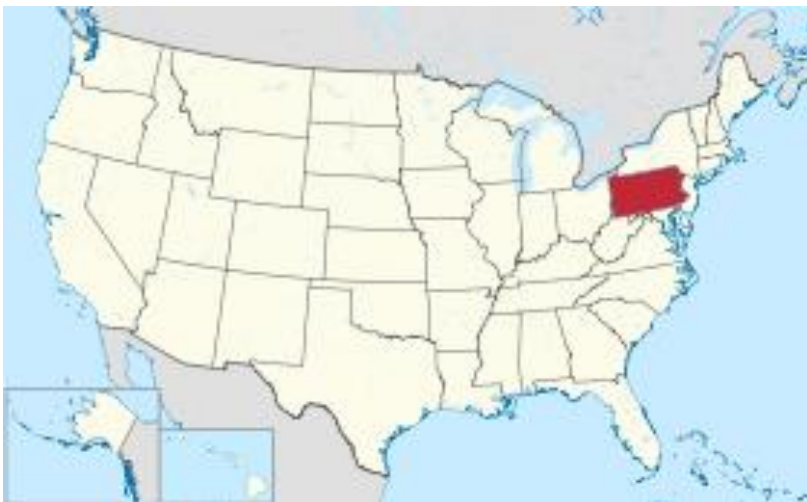
ペンシルベニア州