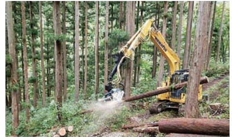
高性能林業機械で森林整備をしている様子

今後は、地域や森林所有者の求めるサービスを探求しながら、林業の課題解決に取り組むとともに、働く職員の安全・安心な労働環境の向上に努め、より魅力ある森林組合をめざしていきます。