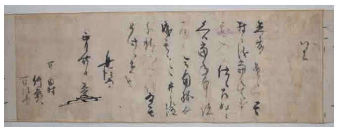
南魚沼市指定文化財 坂戸城主 堀直奇の達し

郷土の歴史・文化を後世に伝えていくため、地域に残る歴史資料の調査・収集・保存を行なっています。収集した資料などを活用し、古文書教室、講演会などを行なっています。また、町史の販売も行っています。