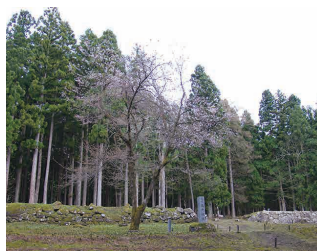
坂戸城跡御館の石垣

坂戸城跡をはじめとする国、県、市が指定した文化財について関係団体と連携して保護に努めます。