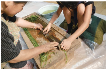
苧引き体験の様子

8月 のびのび越後上布体験講座（小学生向け） 2月 越後上布体験講座（一般向け）