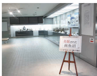
南魚沼市民会館展示室