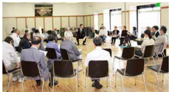
平成30年度の「市長と市民の車座会議 ざっくばらん」の様子