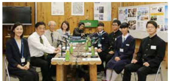
平成30年度は通常開催のほか、 中学生を対象とした ざっくばらん特別編を開催

昨年度に引き続き、夜間の参加が難しい人や子育て世代の人などが参加しやすいよう、5月20日(月)、23日(木)は日中に開催します。5月23日(木)は、子育ての駅「ほのぼの」で子どもを遊ばせながら一緒に参加することができます。終了後、子ども向けの遊びのコーナーも開催予定です。