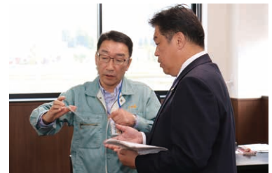
林市長の企業訪問 製品についての説明を受ける

平成3年6月に設立し、主にロボットを使用した機械システムの導入提案や設計、組み立てなどを一貫して行う会社です。電気自動車やスマートフォンで活用される電子デバイスメーカーが顧客で、市内だけでなく世界規模で仕事を増やしています。電子デバイスの開発傾向は、おおまかに小型化、大容量化、省エネルギー化の3つに絞られ、当社は省エネルギーデバイスに特化して事業を展開しています。社員は40人で、半数は中途採用です。ほかの地域からUターンしてきた社員もいます。市外で類似した業種の企業に勤めていた人が、市に帰りたと思ったときに受け入れられるよう、製造業のなかで最も洗練された技術をもつ企業をめざしています。