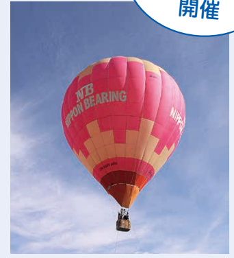
小千谷法人会大和地区会事業