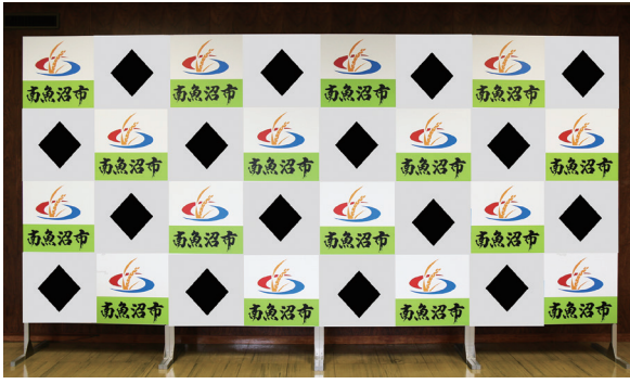
◆の部分に広告を掲載します。

市公式インターネットボードを32区画に分割し、16区画を有料広告、その他を市の区画として、交互に配置