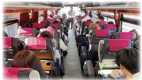
帰省バス車内の様子