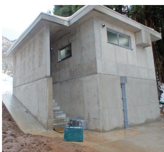
かにさわ 蟹沢配水池