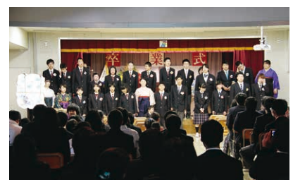
写真は、総合支援学校の卒業式の様子です

総合支援学校では、卒業生が参列した家族、地域の人、先生に向けて、パネルなどを使って感謝の気持ちを伝えました。