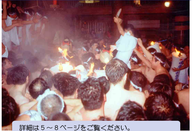
詳細は5～8ページをご覧ください。 おまつりパンフレットとしてもご利用いただけます。