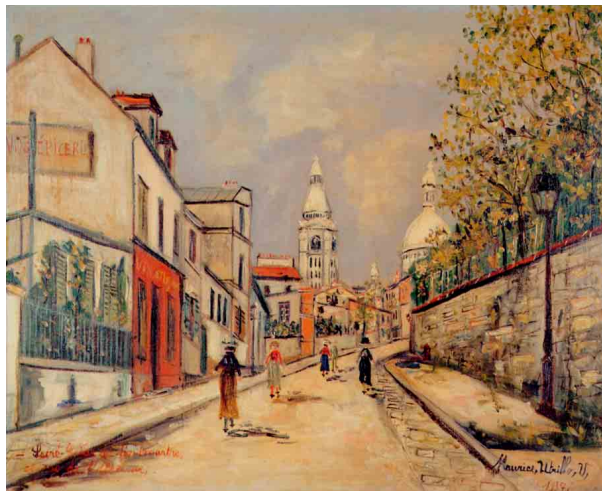
ユトリロ/モンマルトルのラブルヴォワール通り(油彩・カンヴァス)