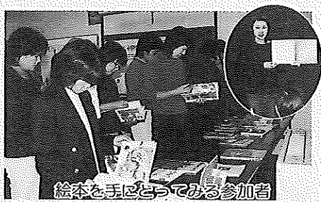
絵本を手にとりつづめる参加者

※ほかにも絵本を含む児童書をはじめ、たくさんはありました。ご利用お待ちしております。