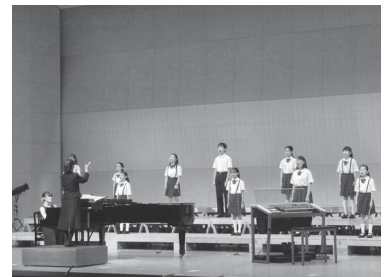
リリカコンサート