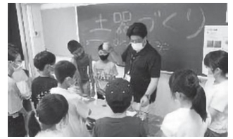
考古学体験 土器づくり