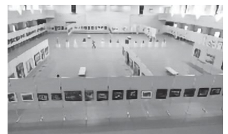
南魚沼美術展覧会