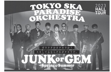
東京スカパラダイスオーケストラ