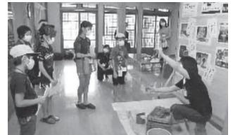
のびのび越後上布体験講座