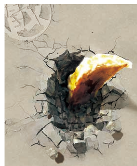
餃子通り壁面アート

また、市内に「餃子通り」という場所があることをご存じでしょうか？そこには老舗店を含む5店舗の餃子店が立ち並ぶほか、餃子通り壁面アートや餃子型の街灯、GYOZAモニュメントなど、見て楽しい餃子モチーフのものがいくつも点在しています。餃子のまちならではの景観と、おいしい餃子をぜひお楽しみください！