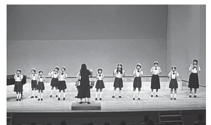
コーラスフェスタの様子