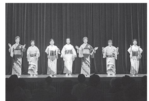
学習発表会の様子