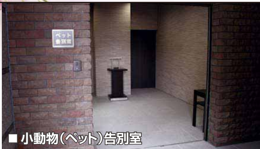
■ 小動物(ペット)告別室