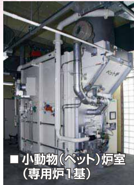
■ 小動物(ペット)炉室 (専用炉1基)