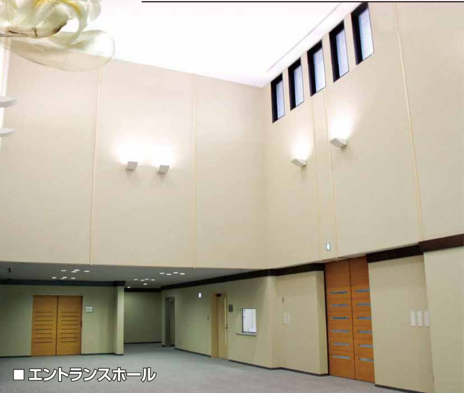
■ エントランスホール