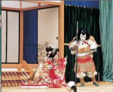
Ikazawa Kabuki Play

五十沢歌舞伎 興業に訪れた歌舞伎一座の巡業と一緒に回った桑原関十郎が地元五十沢にもどり、若者たちに芝居や踊りを教え、基礎をつくりました。