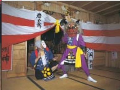
Azechi Kagura Dance