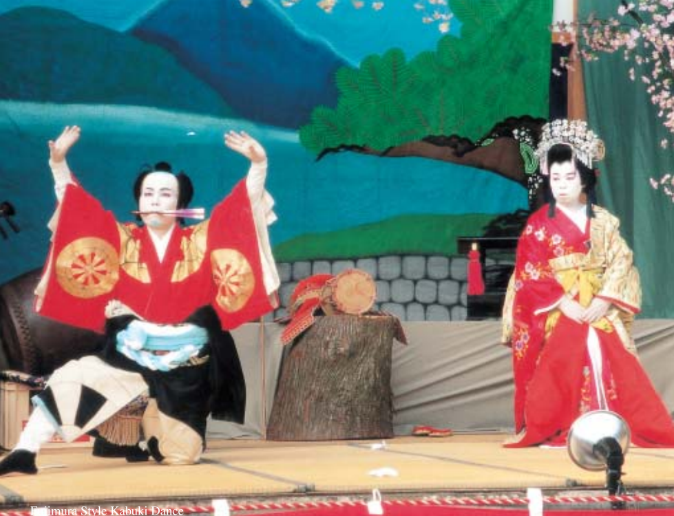
Hitomura Style Kabuki Dance

悠久の時の流れにはぐくまれ、先人が大切に守り残してきた歴史文化遺産。この地には、雪国ならではの独特な風習や文化がいまなお息つき、次代を担う子供たちへと継承されています。