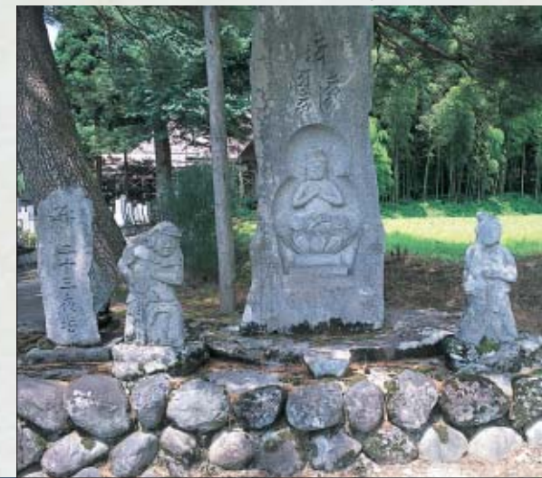
Stone Figure of Tarobeh Buddha

塩沢地歌舞伎 江戸時代より伝わる伝統芸能の一つで、塩沢地域では「地歌舞伎」と呼ばれています。当時、歌舞伎は相撲と並ぶ人気行事でした。