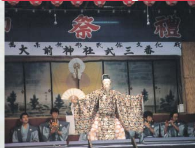
Osaki Shrine Shiki-Sanba

藤村流歌舞伎踊り 五十沢出身の歌舞伎役者が地元の人たちに教えた踊りです。主なものに仕方踊り、踊り松坂、地追分、おけさなどがあり、この写真は非常に珍しい、義経千本桜吉野山道行の一場面です。