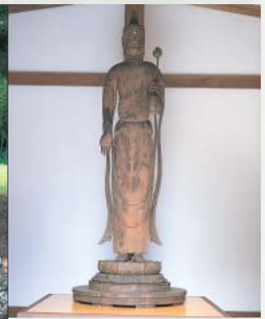
Kimigaeri Kannon (Goddess of Mercy)

君帰観音 文治3年(1187)源義経が京都より従者とともてに落ち延びてきた時に、この観音像を捧持して滞在していました。