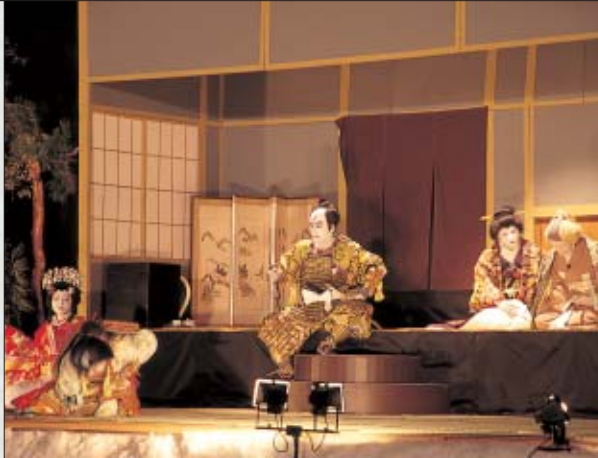
Shiozawa Land Kabuki Play

一村尾若宮八幡宮 太々御神楽 名工北川岸次の手による32の神楽面を有し、毎年6月の例大祭では伊勢系と出雲系とが混在した26座の神楽が5時間にわたり休みなく奉納されます。